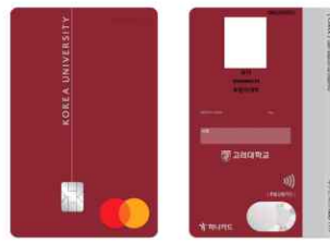
금융(실물) 학생증[선택 발급]

※ 국제학생(외국인): 비금융 학생증(입학 지원서 사진 제출자 대상) — 일괄 제작, ONE-STOP서비스에서 수령 (International Students (Foreign Nationals): Non-financial Student ID (photo submitted with admission application) — Issued in batch, Receipt from one-stop service)